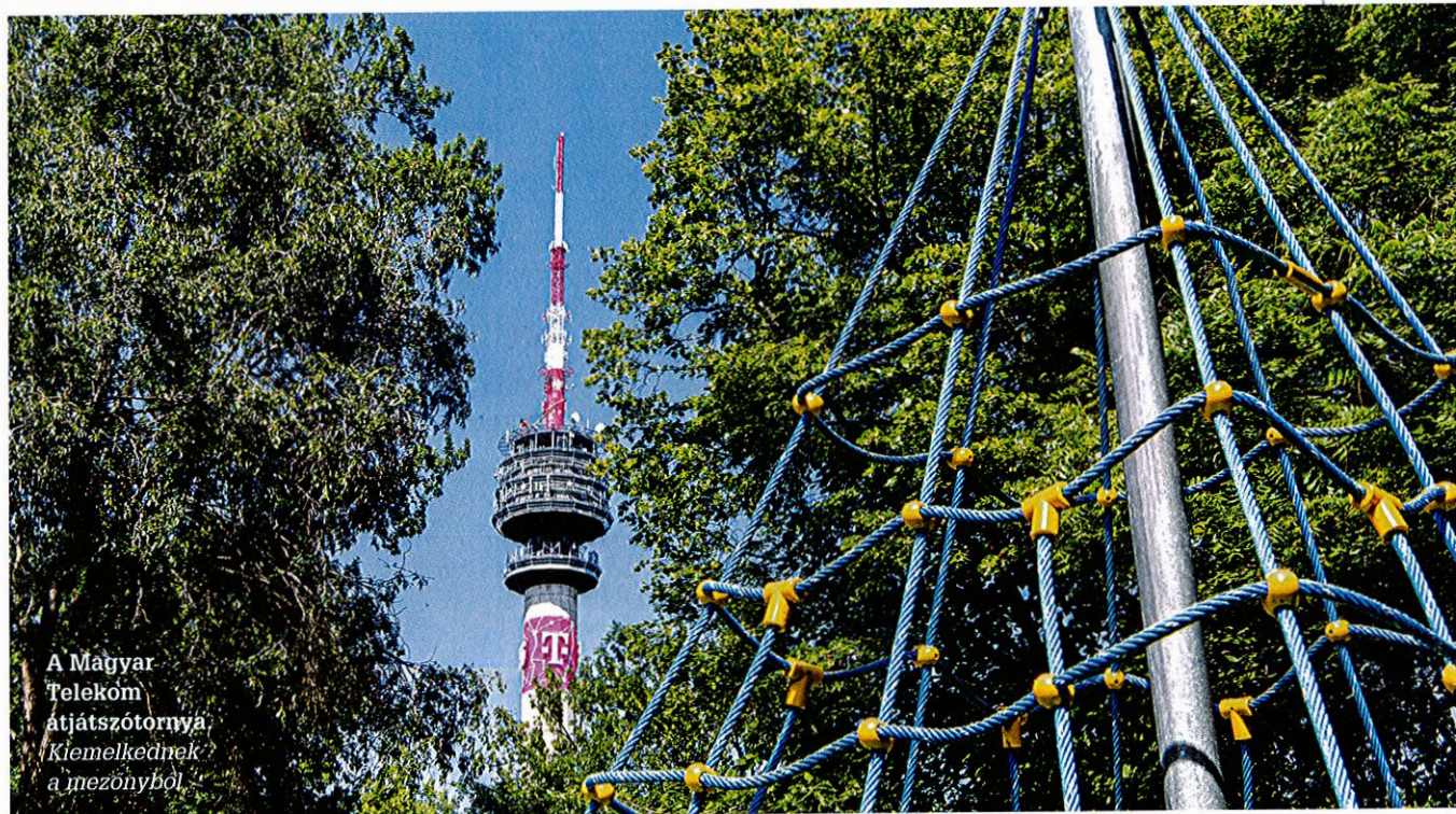
A Magyar Telekóm átjátszótornya. Kiemelkednek a mezőnyből.