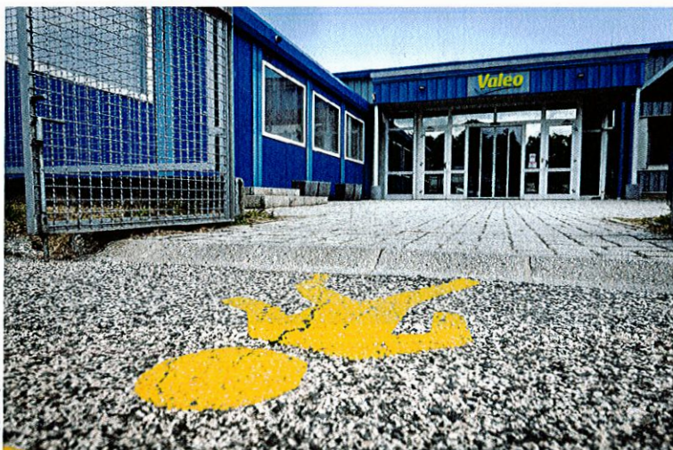
A Valeo üzeme előtt. Lendületben

Az ESG lényegét jelentő három fő dimenzió közül környezeti szempontból a Magyar Telekom-csoport, az E.On Hungária-csoport és a Market Építő jutott fel a dobogóra, megelőzve a CIB Bankot és a Richter Gedeont. E területen a vizsgált hét szempont közül a 2022-es kibocsátásintenzitásában és a vízfogyasztás intenzitásában a Hankook Tire Magyarország szerezte meg az első helyet, a kibocsátási intenzitás 2020-hoz (vagy a bázisévhez) képest elért csökkentése és az üzemanyag-fogyasztási intenzitás relatív változása szempontjából pedig az E.On Hungária-csoport végzett az élen; amikor azt vizsgálták, mekkora a megújuló aránya az összes energiafelhasználásban, akkor az Audi Hungaria, a Magyar Telekom-csoport, a Samsung Electronics és a Tesco-Global bizonyult a legjobbnak, a hulladékintenzitás relatív változása tekintetében pedig a Mol-csoport vezeti a sort. A hulladék-újrahasznosítási arány alapján a Yettel Magyarország teljesített a legjobban (bevallásuk szerint 100 százalékkal), öt követi a Mercedes-Benz Manufacturing Hungary (99,94 százalék), majd a Market Építő (75,9 százalék).